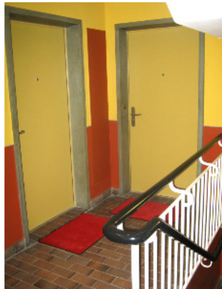
Klosbachstr. 88, 8032 Zürich