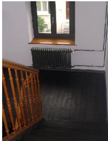
Grellingerstr. 27, 4052 Basel