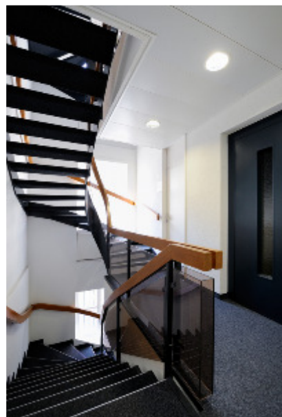
Rämistr. 36, 8001 Zürich