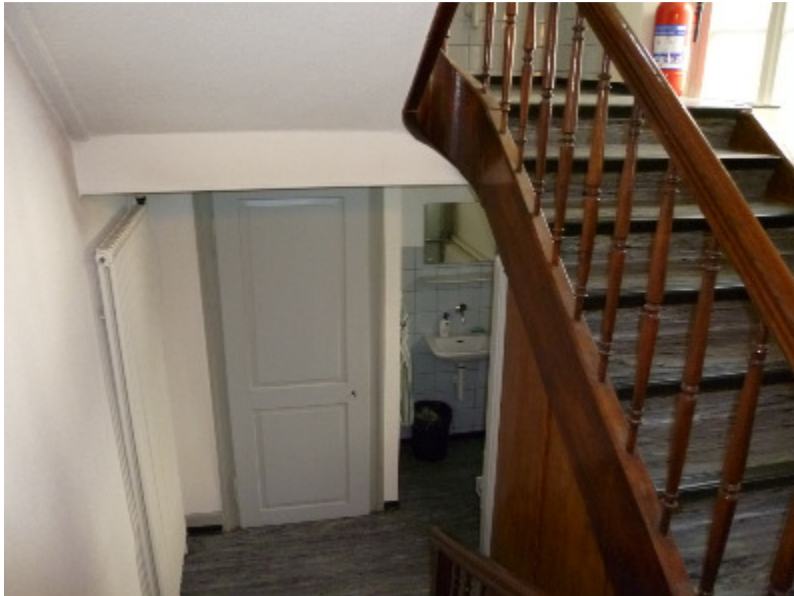
Stampfenbachstr. 125, 8006 Zürich