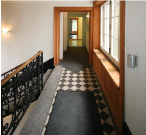
Limmatquai 144, 8001 Zürich