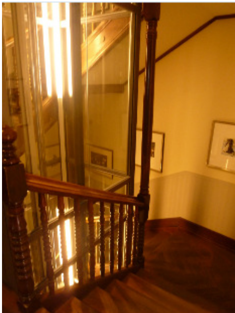
Kirchgasse 48, 8001 Zürich