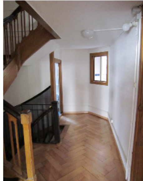
Untere Zäune 3, 8001 Zürich