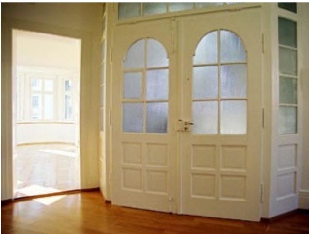
Minervastr. 93, 8032 Zürich