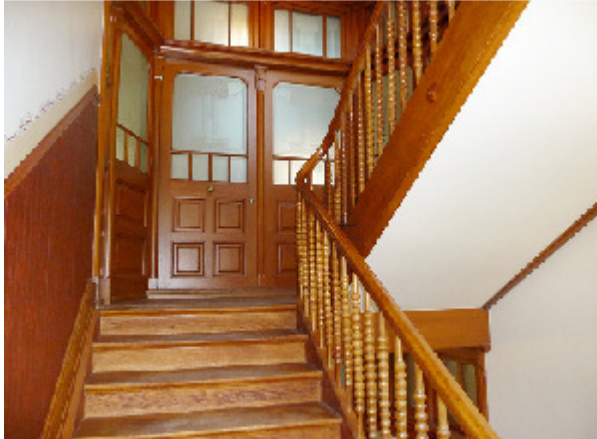
O.g.A., 8044 Zürich (1906)