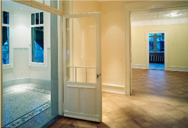
O.g.A., 8044 Zürich (1906)